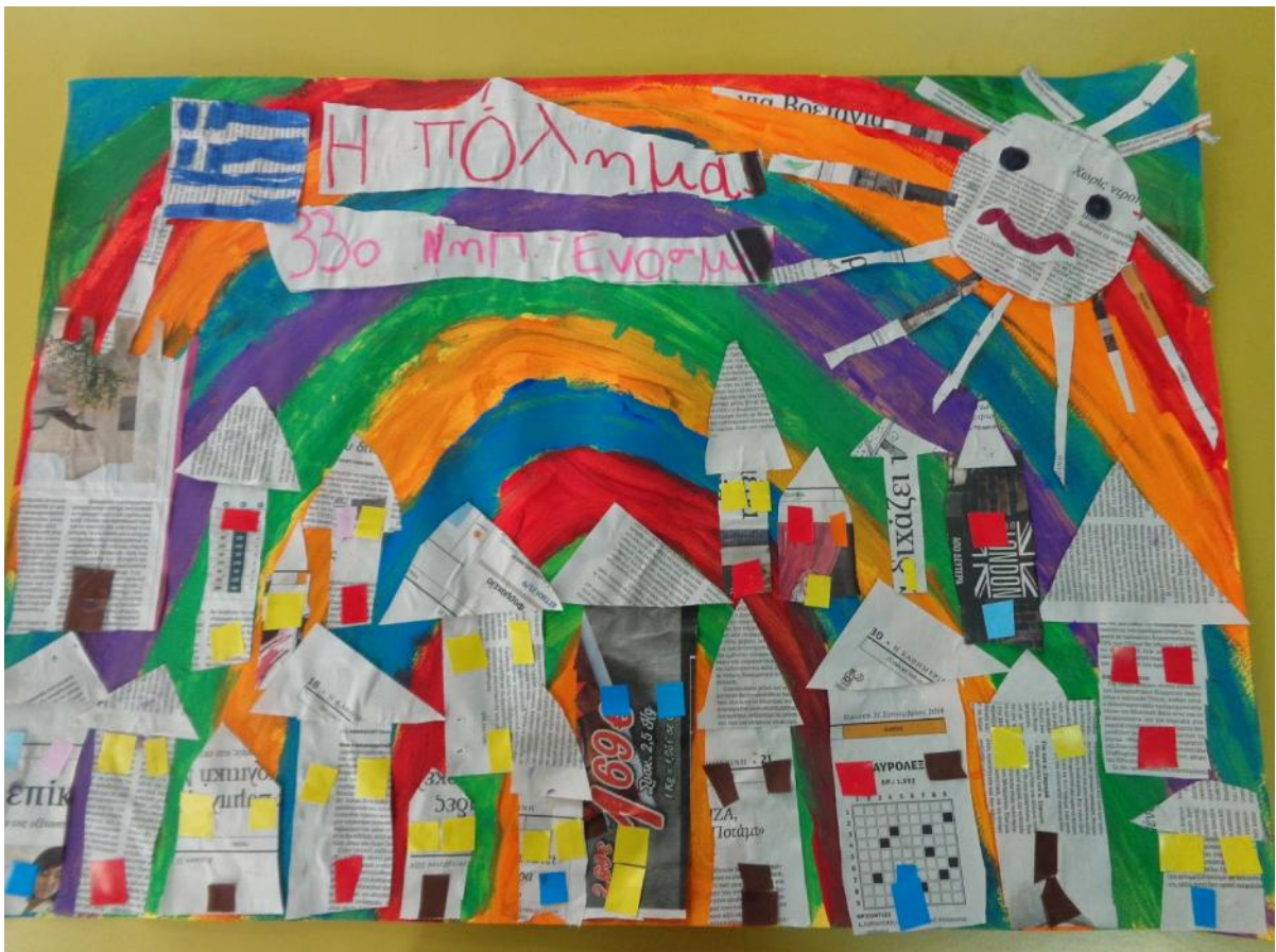
33ο Νηπιαγείο Ευσόμου