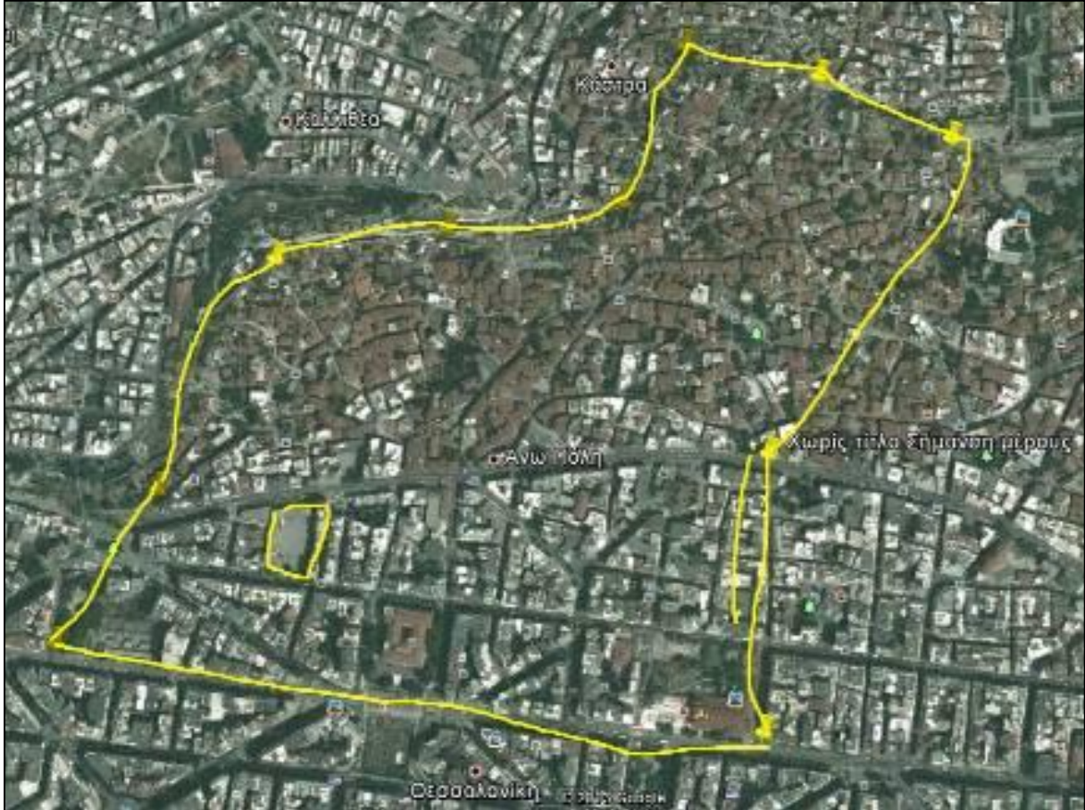
26ο Γυμνάσιο Θεσσαλονίκης

Πού βρίσκεται η γειτονιά σας σε σχέση με την πόλη;