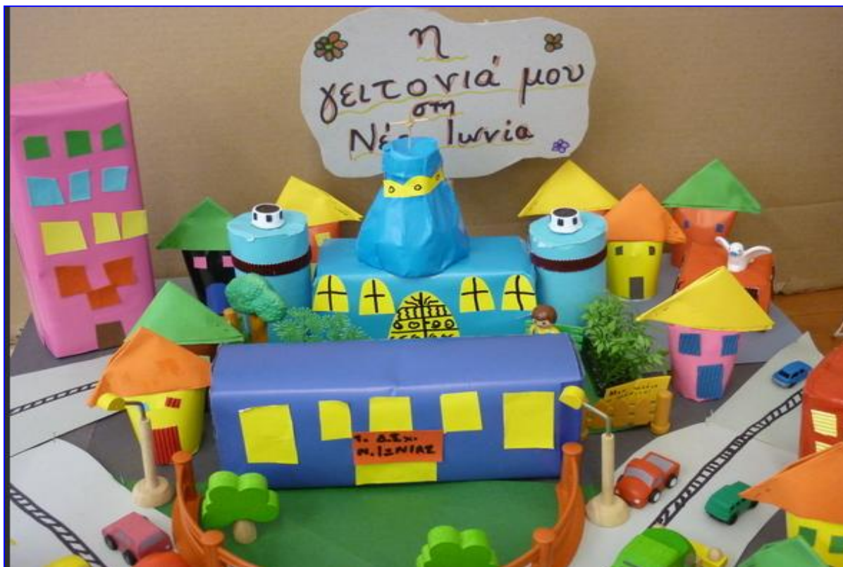
1 ο Δημοτικό Σχολείο Ν. Ιωνίας

Παραγόμενα: Αφηγηματικό θεατρικό κείμενο.