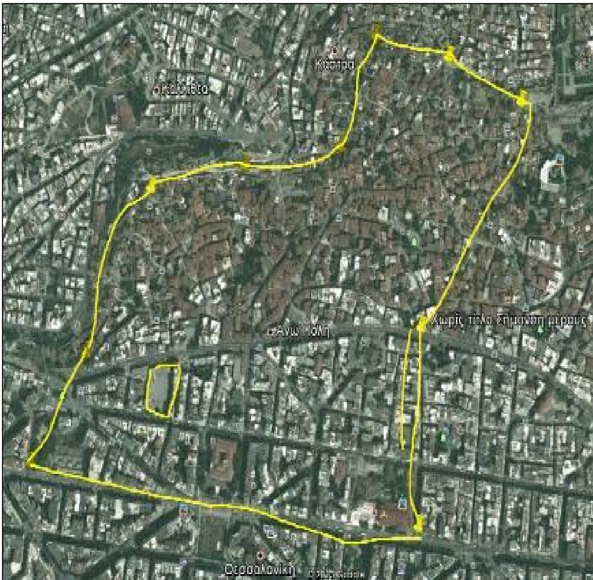
26ο Γυμνάσιο Θεσσαλονίκης

Φυσικά μπορείτε να επιλέγεται και όποιος άλλος τρόπος κρίνεται πρόσφορος.