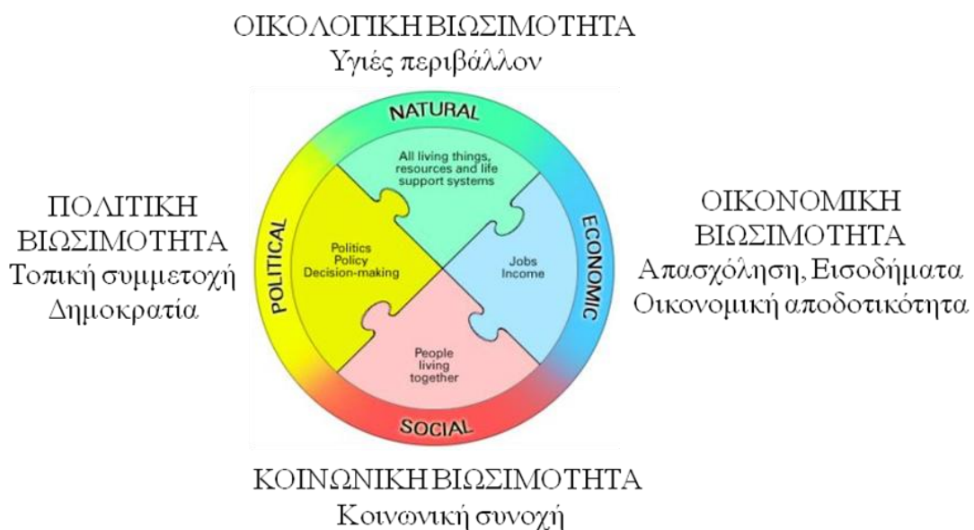
Σχήμα 1. Διαστάσεις της αστικής αειφορίας (προσαρμοσμένο από © UNESCO 2010, www.unesco.org/education/tlsf/TLSF/theme_a/a_mod04.htm ).

την πολιτική βιωσιμότητα – συμμετοχή, λήψη αποφάσεων, δημοκρατία